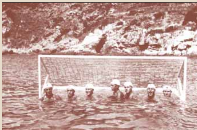
Vaterpolisti Juga 1924. godine

Ljeti, prije početka I. svjetskog rata, oživjele su uvale grada pod Marjanom, do tada puste zbog udaljenosti od centra. To su prije svega bile uvala Baluni na zapadnoj i Firule na istočnoj strani grada. U tim je uvalama omladina osnovala tzv. republike, gdje su svi njeni "stanovnici" uživali potpunu slobodu. Razvijalo se drugarstvo, zdravi oblici života u moru i kraj njega, borbenost i razne vještine. One su bile pokretači gotovo svih športova u Splitu. Djelatnost "republika" nigdje nije službeno verificirana, ali je njihovo postojanje osnova iz koje su se razvili brojni splitski klubovi. Iz "Republike Mali puk" u uvali Firule kasnije su nastali plivačko-vaterpolski klubovi Firule , Triton i POŠK . U uvalama Bačvice i Baluni djelovale su istoimene "republike", "Bagno polo" u gradskoj luci, a "Republika Sustipan" u uvali Zvončac. Tijekom 1919. i 1920. prestaje djelovanje "republika" i počinje organizirani razvoj plivačkog i drugih športova u Splitu. Na temeljima "Republike Baluni" počeo je nicati prvi plivački klub u Splitu i Dalma-